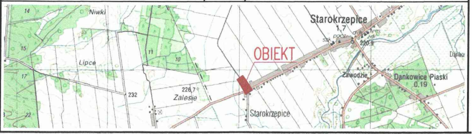
Szkic lokalizacji roboty Skala 1:25000

GEODETA UPRAWNIONY Tomasz Sobczak 98-300 Wieluń, os. Armii Krajowej 6/54 biuro: 98-300 Wieluń, ul. Targowa 1 tel. 603-754-088 NIP 832-140-96-46 REGON 730929660 Numer uprawnień: 16907 (zakres 1, 2)